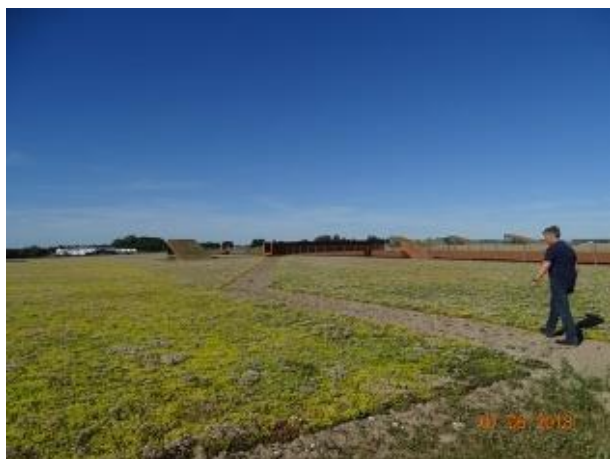
På taget af det nye rensesanlæg