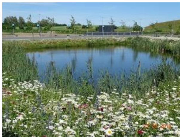
Sø ved genbrugspladsen